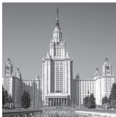
● МГУ им. Ломоносова

дневники», где были собраны ценные сведения и свидетельства устной истории по старообрядчеству, народной медицине, промыслам нашего края.