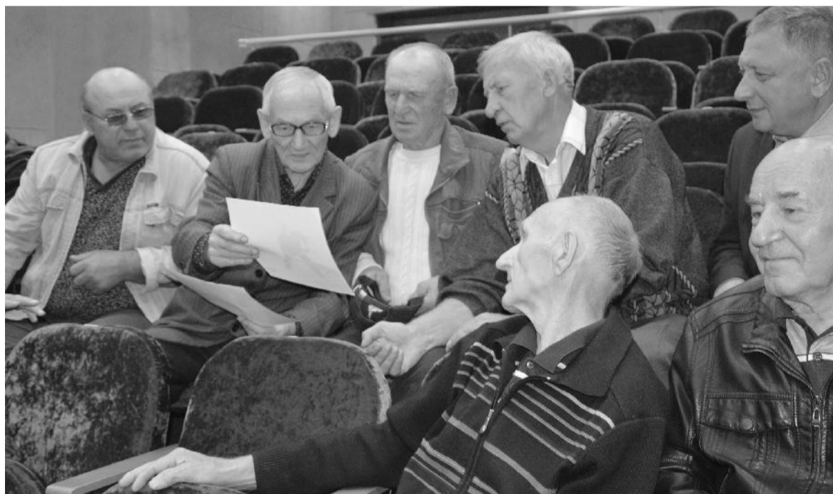
● Во время встречи с ветеранами-хоккеистами