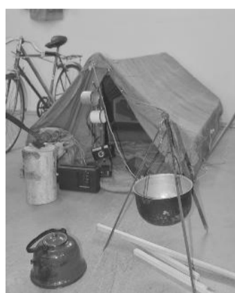
● Экспонаты музея ФОКа «Спарта»