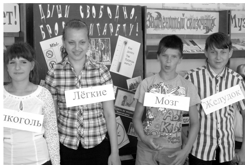
● Участники мероприятия

В качестве альтернативы курению ведущие предложили учащимся выполнить физические упражнения под зажигательную песню на слова В. Высоцкого «Гимнастика», их инициатива была подхвачена с огромным энтузиазмом всеми присутствовавшими, которые получили массу положительных