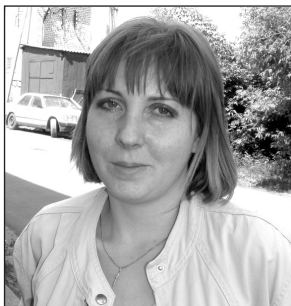
Записала А. СЕМЁНОВА

– В отпуск планирую уйти в июле, проведу его дома. Живём мы в Карпове рядом с рекой Устой. Будем с мужем и сыном ходить на рыбалку, купаться, обязательно съездим в лес. А вообще, моё любимое место отдыха – огород. Там мой маленький цветочный рай, в котором приятно не только отдыхать, но и работать.