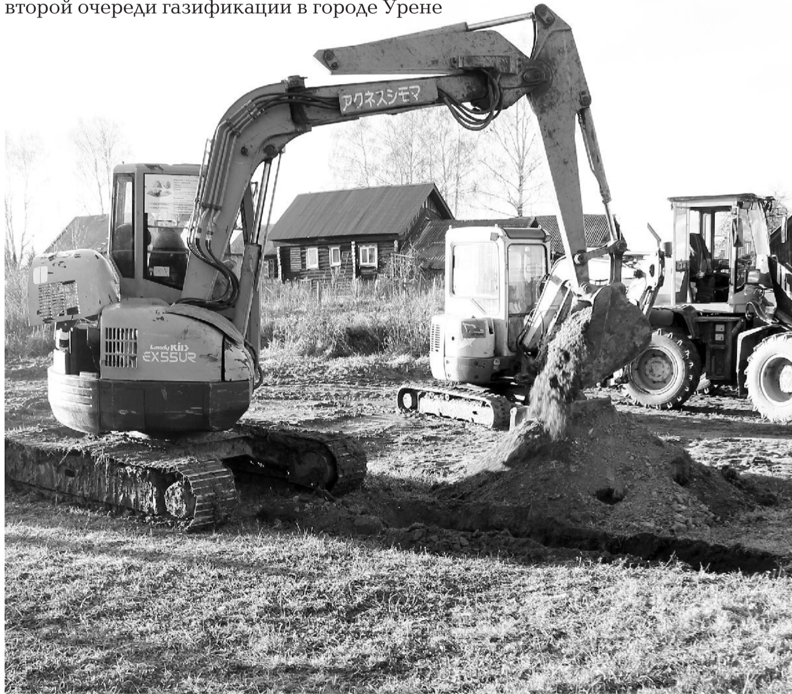
● Начало прокладки газопровода на улице 1-й Железнодорожной в г. Урене

Казалось бы, ничем не примечательный осенний день 25 октября 2021 года вошёл в историю Уренского муниципального округа как начало строительства второй очереди газификации в городе Урене