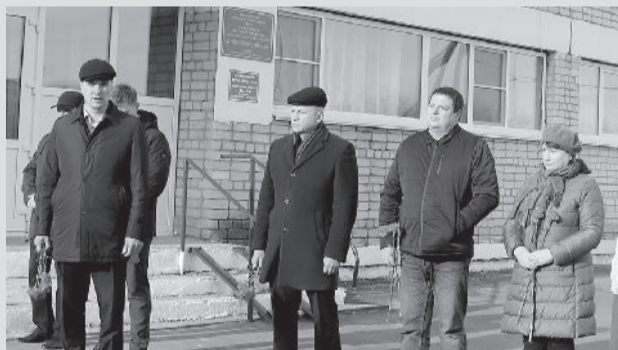
● Участники митинга