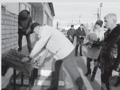
● Возложение цветов