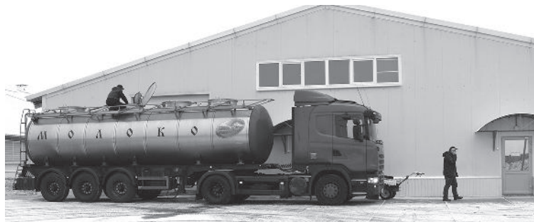
● Горевский животноводческий комплекс