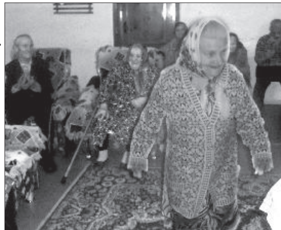
● Участники встречи

Ушедшие и уходящие в небытие русские деревни. Сколько их? Какие названия они носили? Кто в них жил? Тихо и незаметно уходят они из нашей памяти, и всё же боль потери сильна. Пока ещё не поздно, мы должны вслушиваться в голоса былого.