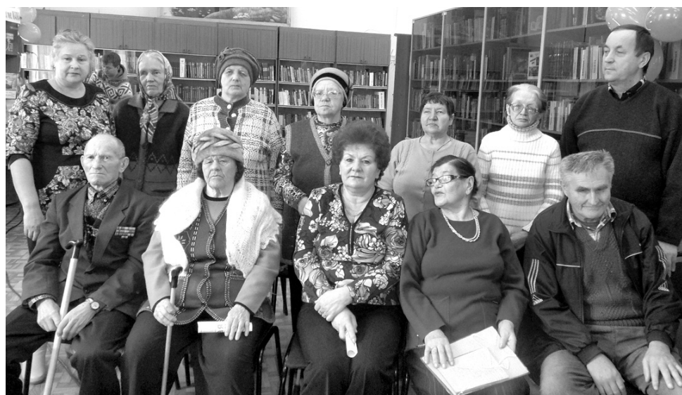
● Участники мероприятия