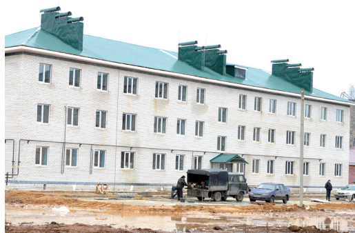
● Дом на улице Индустриальной

переселению в эти дома, должны встретиться в новых квартирах.