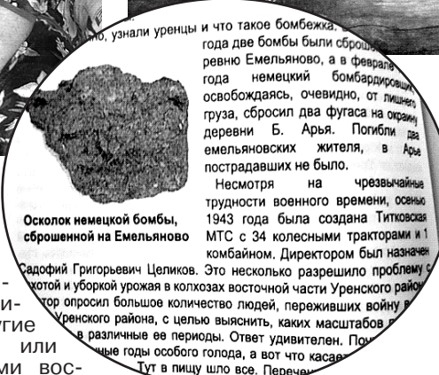
Осколок немецкой бомбы, сброшенной на Емельяново

го жителя деревни: у кого-то погибли близкие, кто-то остался без крова и им придётся переехать в другие населённые пункты или собственными силами восстанавливать свои жилища. Помощи ждать неоткуда, в стране война.