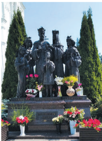
● Народный памятник царской семье в Дивеево

Я незаметно любовалась ими. Женщины в длинных юбках (как же удобно в них ходить!), в платочках и шарфиках, белых, розовых, голубых, без косметики на лице. Какие они все красивые! А лица мужчин – это вообще что-то особенное. И причина здесь не в бороде (многие вообще без неё), а наверное, в благоговейности, в особой неторопливой походке и в какой-то внутренней силе. Наверное, это и есть сила духа... Как всё-таки преображают лица людей вера и молитва! «Обрати, Господи, безобразия лица моего в красоту», – поётся в одном из тропарей Страстной седмицы. И такая была радость находиться среди этих людей, ощущать