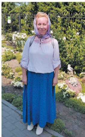
● Вот бы остаться здесь навсегда

О красоте и величии четвёртого удела Богородицы написано много. Редкий человек там не побывал. Это место при-