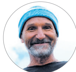
● Пётр Мамонов

На обратном пути в моей голове кружились разные мысли. Например, о Петре Мамонове, актёре, музыканте и поэте, умершем за день до нашей поездки в Дивеево. О человеке, у которого в 45 лет было всё: слава, деньги, работа, семья, но ему почему-то в один момент стало не зачем жить. И которого внезапно «пробило», и он «комариными шажками» пошёл в Царствие Небесное. И показал всей своей дальнейшей жизнью, как в наше тревожное,