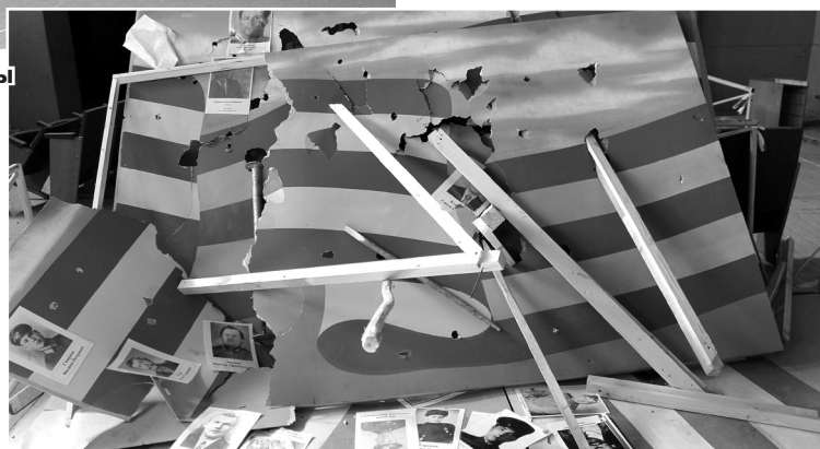
● Вот что осталось от «Стены Памяти»

Н.В. КРУГЛОВА: «ОЩУЩЕНИЕ ТАКОЕ, БУДТО МОГИЛЫ 250 ГЕРОЕВ ОСКВЕРНИЛИ. БУДТО ПРАХ ИХ ПОДНЯЛИ И НАД НИМ НАДРУГАЛИСЬ».