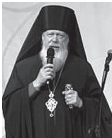
● Епископ Августин

7 ноября 2017 года в Городецкой епархии под руководством епископа Городецкого и Ветлужского Августина прошли III епархиальные Рождественские образовательные чтения