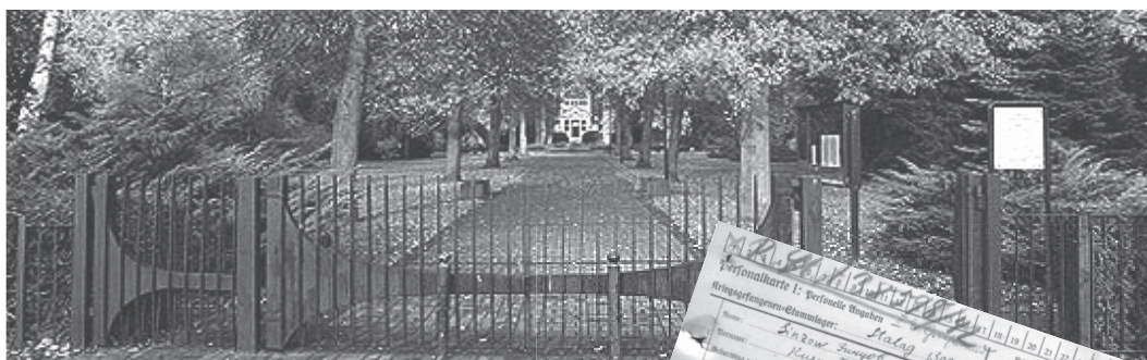
● Кладбище советских военнопленных в г. Грейфсвальде

Но после проверки этих данных оказалось, что Гросс Борн — это немецкое название города Борне Сулиново,