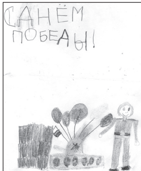
● Костя Родионов, 6 лет, д/с «Теремок»