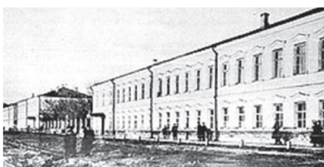
● Костромская духовная семинария