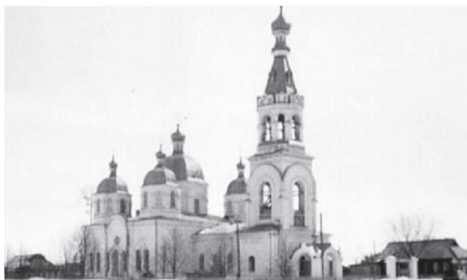
● Храм в с. Роженцово