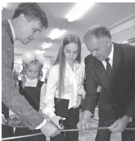
Арьёвская средняя общеобразовательная школа