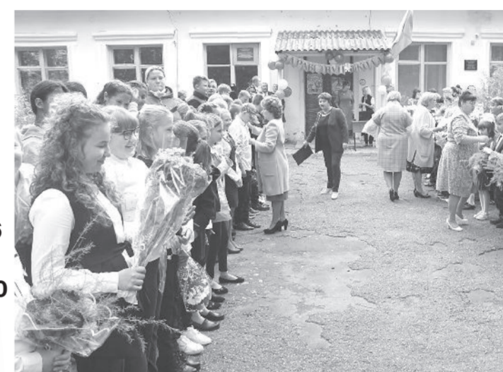
Темтовская основная общеобразовательная школа

В этом году за школьные парты сели 3287 учащихся