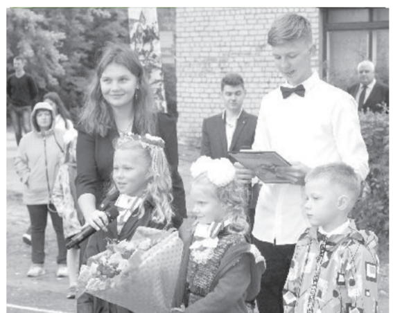
Уренская средняя общеобразовательная школа № 1