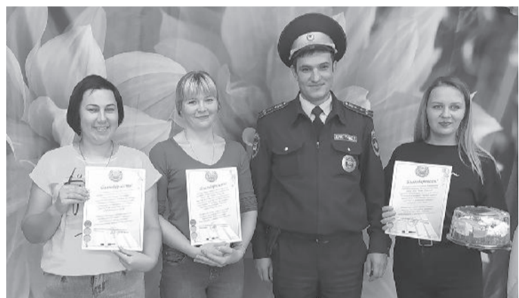
● Торжественный момент награждения