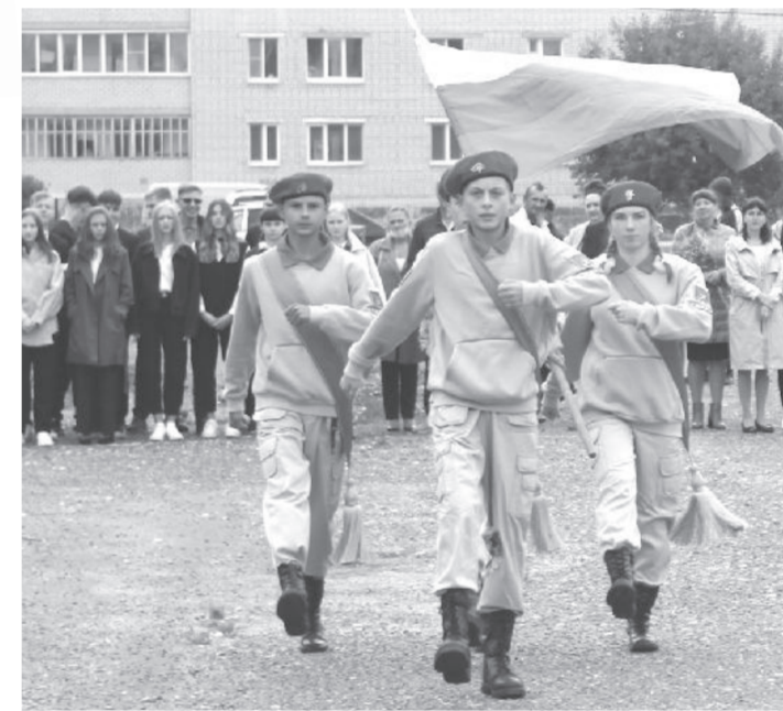
Уренская средняя общеобразовательная школа № 2

Торжественная линейка по случаю начала нового учебного года в Темтовской основной школе началась с построения. На дорожке перед входом в школу заняли места ученики со своими учителями. На самых почётных – первоклассники и будущие выпускники – девятиклассники. Главным признаком пересентябрьского праздника были, конечно, яркие букеты в руках ребят, праздничные наряды виновников торжества.