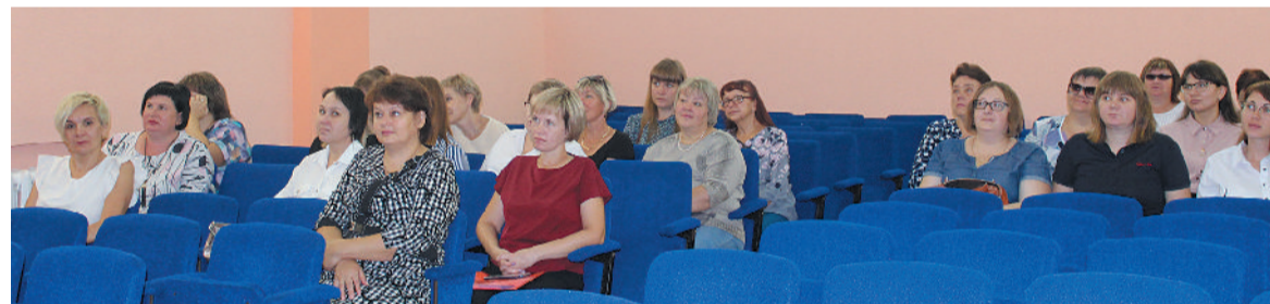
● Участники педконференции

«ДЕТИ ЯВЛЯЮТСЯ ВАЖНЕЙШИМ ПРИОРИТЕТОМ ГОСУДАРСТВЕННОЙ ПОЛИТИКИ, ГОСУДАРСТВО СОЗДАЁТ УСЛОВИЯ, СПОСОБСТВУЮЩИЕ ВСЕСТОРОННЕМУ ДУХОВНОМУ, НАВЕСИТЕННОМУ И ИНТЕЛЛЕКТУАЛЬНОМУ РАЗВИТИЮ ДЕТЕЙ»