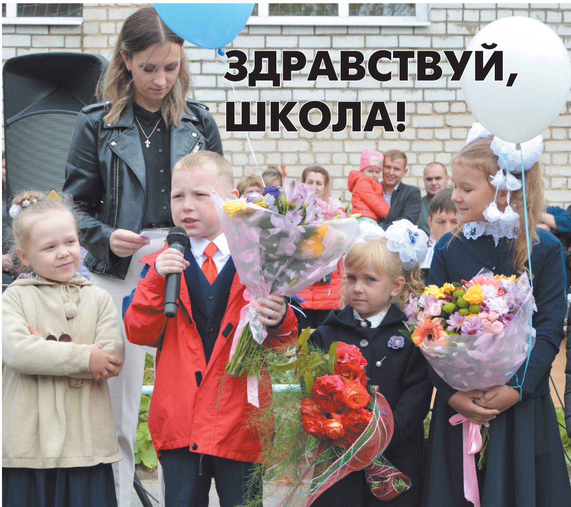
● Первоклассники Арьёвской средней школы на торжественной линейке.

1 сентября в школах округа прозвенели первые звонки