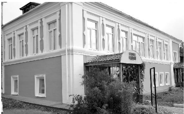
● Музейно-выставочный комплекс им. В.Ф. Мамонтова