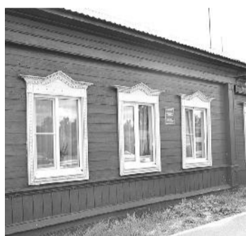
● Уренская детская музыкальная школа

Комфортнее стало и в музыкальной школе. Здесь за счёт собственных средств была проведена частичная замена системы отопления, установлены новые батареи. Яркими