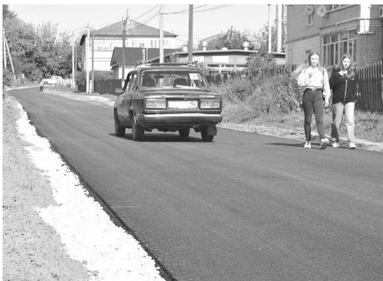
● На ул. Контакт – асфальтированная дорога

К концу августа в Урене было отремонтировано сразу несколько участков автомобильных дорог общего пользования местного значения.