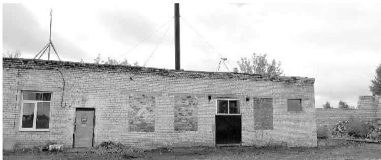
● Котельная № 6

Состоялось заседание комиссии по предупреждению и ликвидации чрезвычайных ситуаций и обеспечению пожарной безопасности округа, на котором рассматривались жизненно важные вопросы его существования.