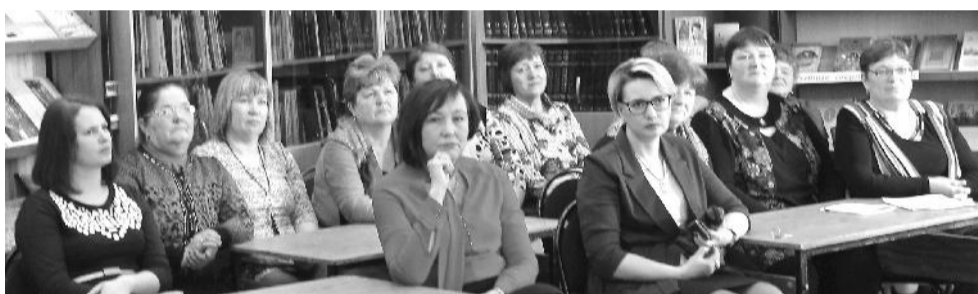
● Участники мероприятия