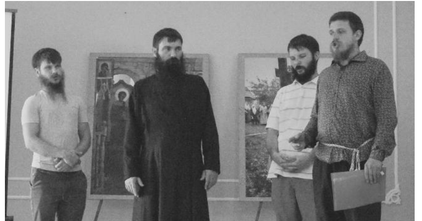
● Представители старообрядческой веры на открытии выставки

В Уренской центральной библиотеке прошло открытие фотовыставки «Потомки Аввакума» (12+), посвящённой 400-летию со дня рождения протопопа Аввакума Петрова. Фотографии рассказывают о жизни и быте потомков тех, кто во время церковного раскола в XVII веке, несмотря на царские гонения, оставался приверженцем старой веры, о тех, кто веками, из поколения в поколение передавал традиции и обычаи отцов и дедов.