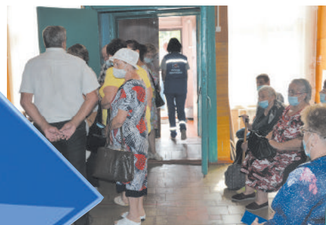
● В ожидании приёма