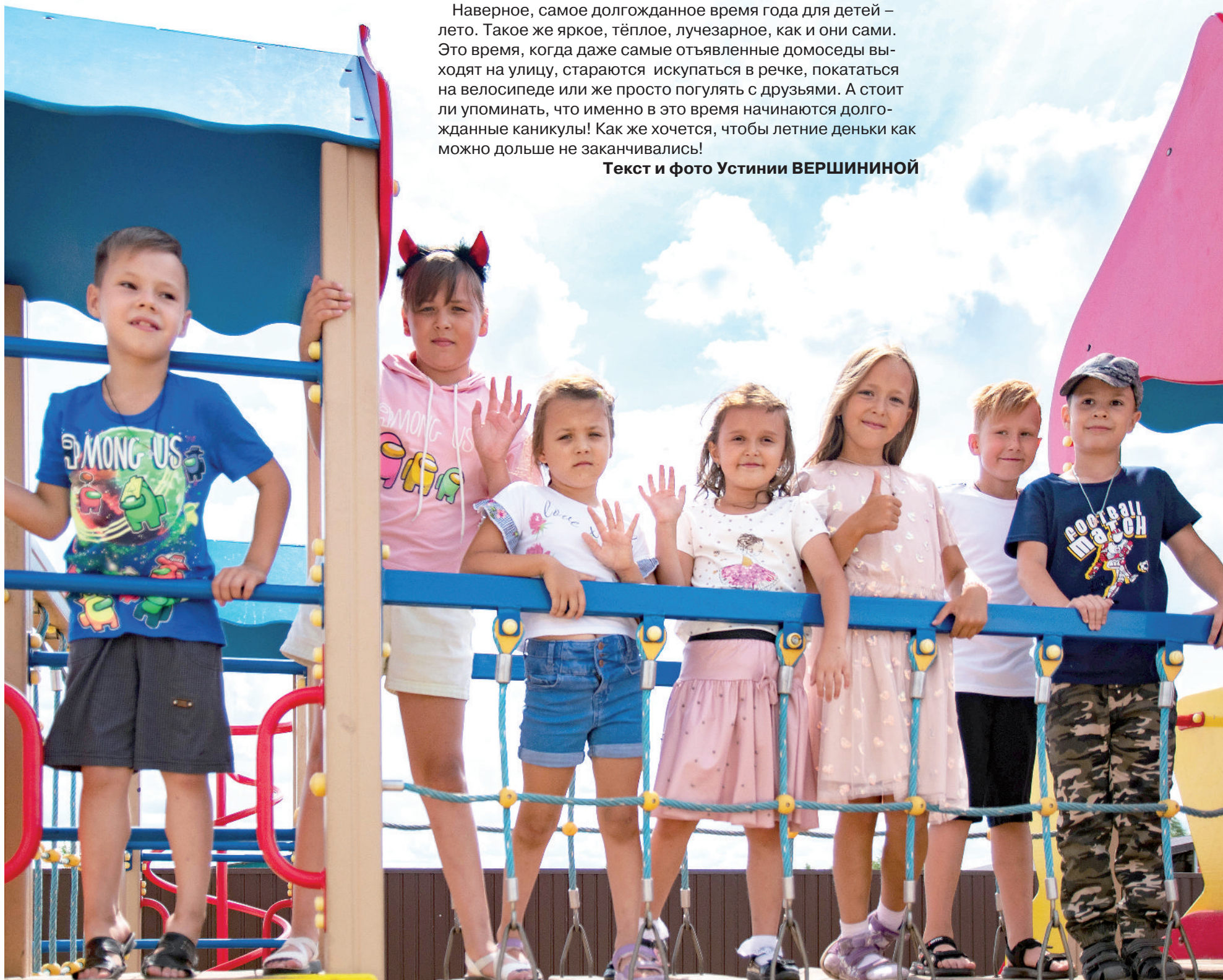
● Весело проводят время дети на игровой площадке