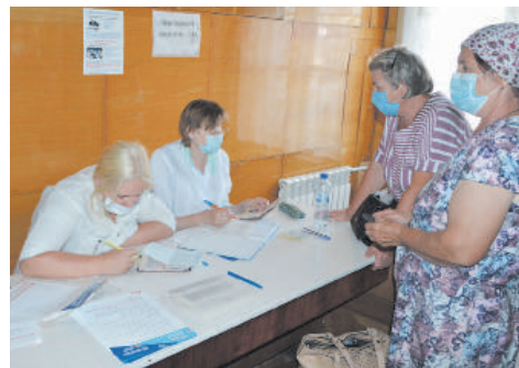
● Регистраторы ведут запись

В Нижегородской области медицина для отдалённых населённых пунктов с 2018 года стала доступнее. В рамках нацпроекта «Здравоохранение» на территории области курсирует Поезд здоровья – целый передвижной комплекс, который оснащён всем необходимым оборудованием для диагностики заболеваний. Теперь к жителям села, которым сложно добраться до врачей, «помощь на колёсах» придёт сама. Чтобы узнать подробнее о работе Поезда здоровья в Уренском округе, мы с утра направились в р.п. Арья, где была запланирована его первая двухдневная остановка. Подъезжаем к Арьёвской больнице и видим, что здесь уже достаточно оживлённо. Два модуля, оснащённые современным оборудованием, уже разместились на территории больницы, а врачи и специалисты готовы для проведения обследований и оказания квалифицированной медицинской помощи. Заходим не наблюдаясь, на приём, кто-то начался приём пациентов.