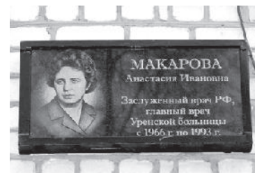
● Мемориальная доска на здании Уренской поликлиники