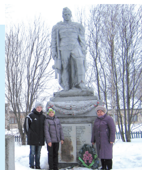
К 70-летию Победы