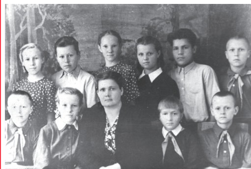
Войной растоптанное детство