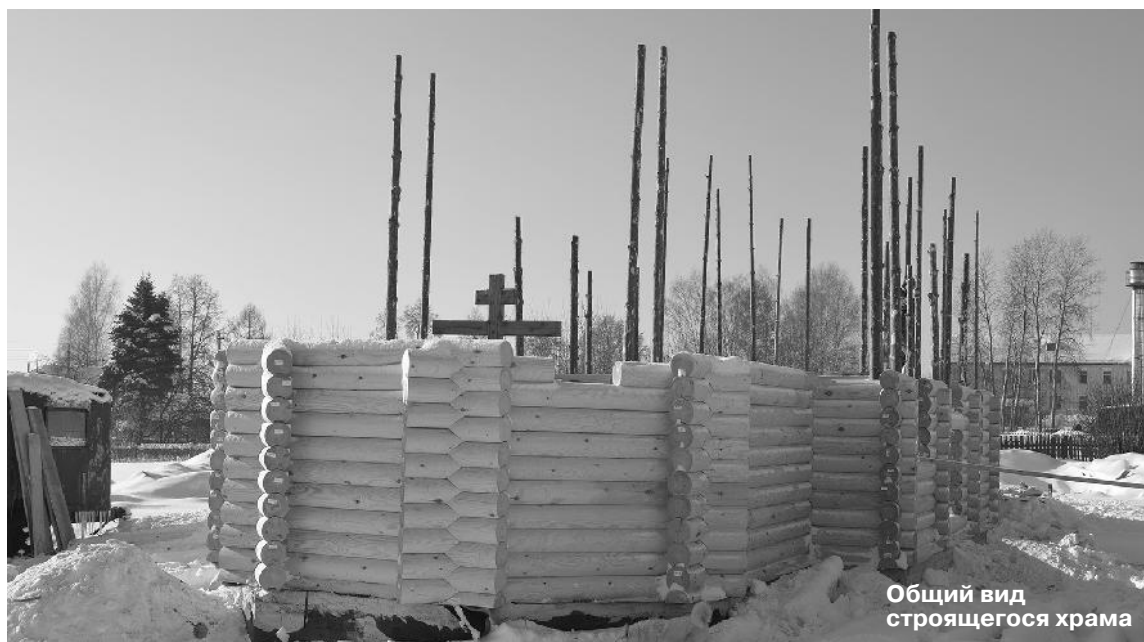
Общий вид строящегося храма