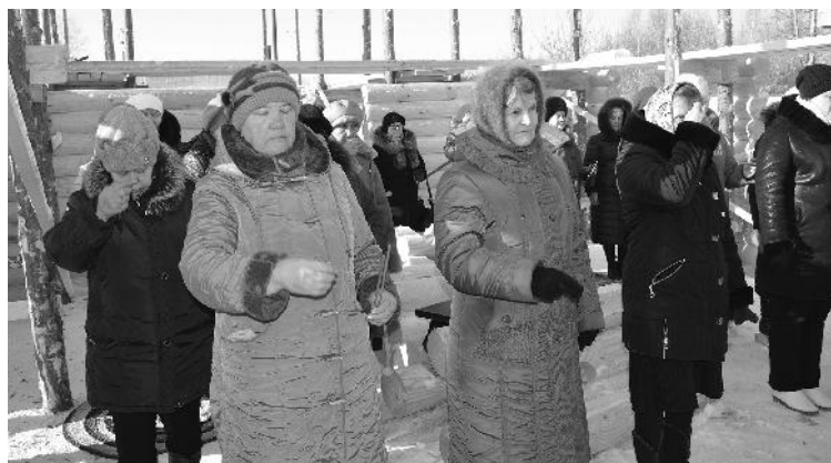
● Прихожане прихода в честь Пророка Божия Илии

ДЕНЬ совершения церковного обряда выдался на редкость погожим: в безоблачном небе ярко светило солнце, явственно ощущался лёгкий морозец, и это было добрым знаком к упованию на осуществление великого дела строительства будущей церкви при неотступной Божией помощи.