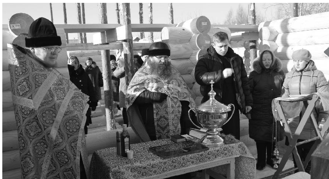
● Начало богослужения