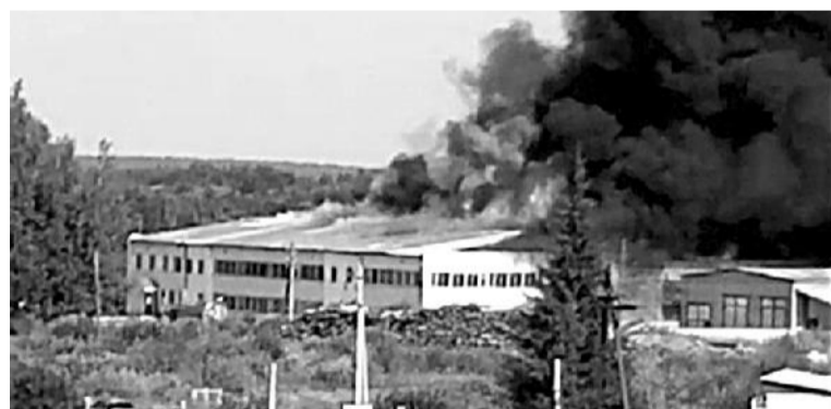
● Возгорание кровли на здании ООО «Фанпром» 8 июля