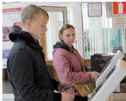
● Услуги МФЦ востребованы